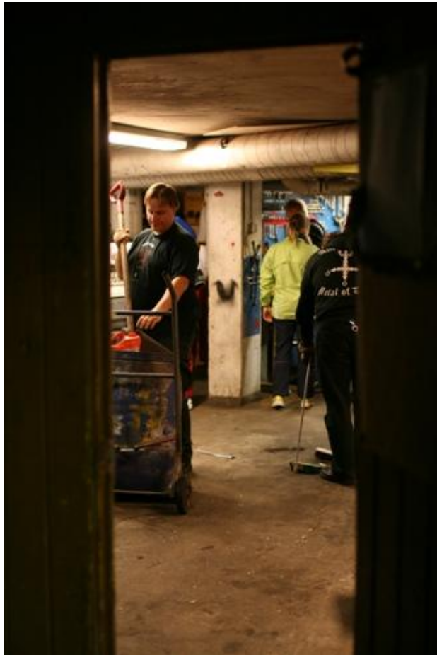
Puheenjohtaja näyttää mallia roskien kippaamisesta

Autokerhon viikkokalenteri pyörii tiistain ympärillä. Tiistaisin vuorottelee hallituksenkokous ja tallisiivous. Hallituksen kokouksessa takahuoneeseen kokoontuu hallitus ja toimihenkilöt pohtimaan kerhon tulevia tapahtumia & käsittelemään juoksevia asioita kuten laskuja.